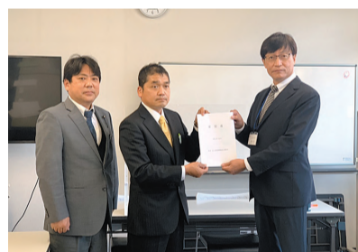
久美浜町の3道路改良期成会の 要望活動