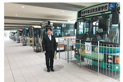
井手やまぶき支援学校 竣工式

新型コロナウイルス感染症においては、3月13日以降のイベントでのマスク着用は「個人の判断に委ねることを基本とする」など状況が大きく変化してきました。京都府主催の式典や地域行事なども、必要な対策はとりながらですが、ご案内いただく機会が増えました。 さまざまな機会を通じて地域の皆さんの声を聴き、丹後の願いを府政に届け、丹後の未来を切り拓いていけるよう引き続き努めてまいります。