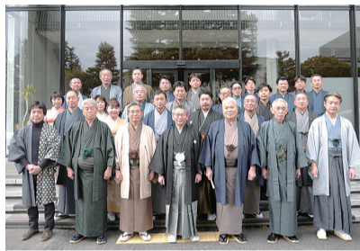
2月定例会着物議会