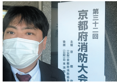
第32回京都府消防大会