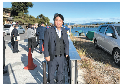
決算委員会現地調査