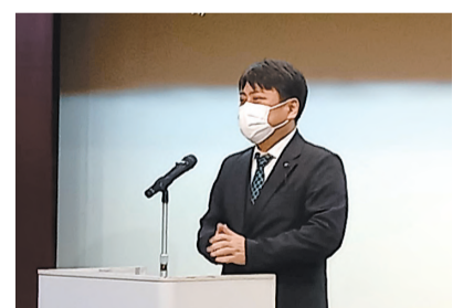
建設業協会新年賀詞交歓会