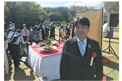
府民交流フェスタ