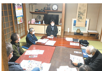
下常吉区の皆さんと意見交換