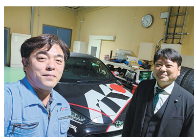
機械金属業について意見交換