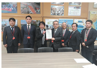
山陰近畿自動車道等建設 促進議員連盟の要望活動