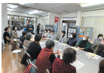
女性の皆さんとの懇談会