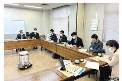
市議会議員さんと 府総合計画の勉強会