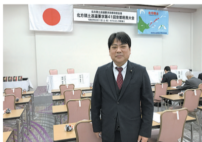
北方領土返還要求 第41回京都府民大会

新型コロナウイルス感染症においては、3月13日以降のイベントでのマスク着用は「個人の判断に委ねることを基本とする」など状況が大きく変化してきました。京都府主催の式典や地域行事なども、必要な対策はとりながらですが、ご案内いただく機会が増えました。 さまざまな機会を通じて地域の皆さんの声を聴き、丹後の願いを府政に届け、丹後の未来を切り拓いていけるよう引き続き努めてまいります。