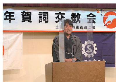
商工会新年賀詞交歓会