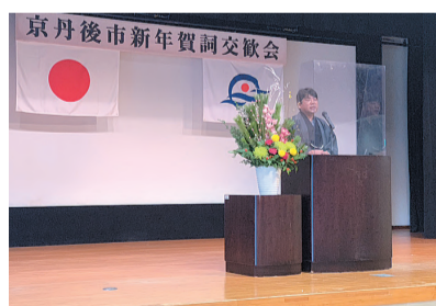
京丹後市新年賀詞交歓会