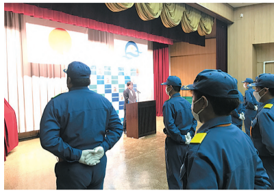
消防団年末警戒を激励