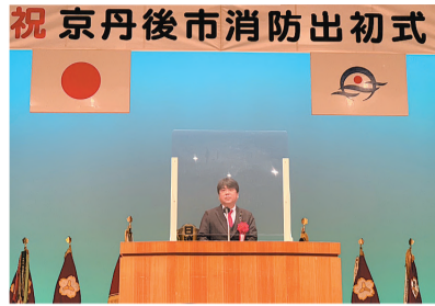
消防出初式での挨拶