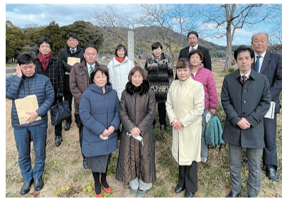
常任委員会管内調査