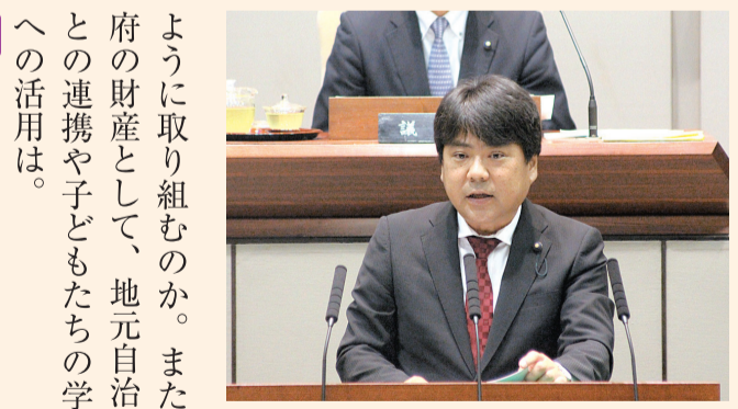
丹後の産業と教育を問う

ように取り組むのか。また、府の財産として、地元自治体との連携や子どもたちの学習への活用は。