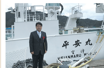
海洋調査船「平安丸」竣工式