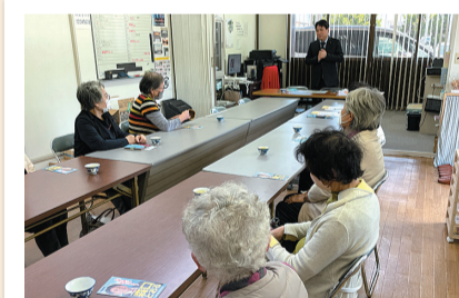
女性の皆さんと意見交換