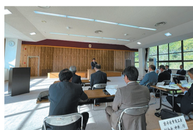
丹後地方商工団体連絡協議会