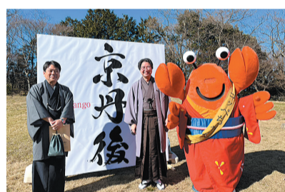
京丹後市はちを祝う式典