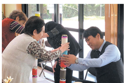
奥大野ふれあいサロン