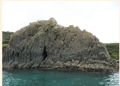
府民の共有財産「山陰海岸ジオパーク」