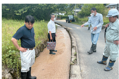
成願寺川土砂流出現地視察