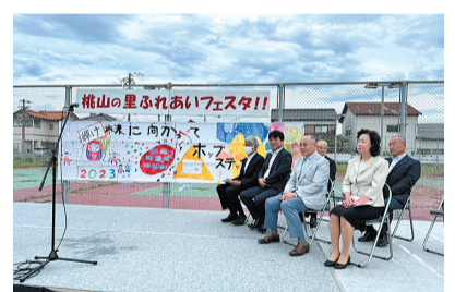
桃山の里ふれあいフェスタ